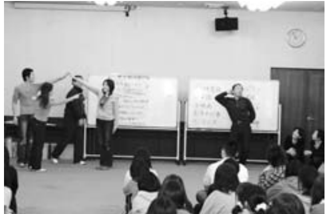
「世界で一番きれいな」那須姫に全員がマイッタ！