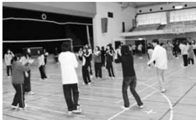
入学して初めてのチーム・ワーク?!ソフトバレー