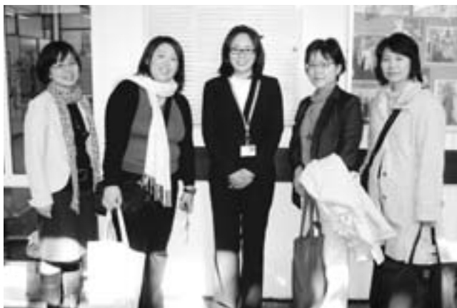
2010年春、UCSFに訪問した本学教員との交流 (中央が筆者)