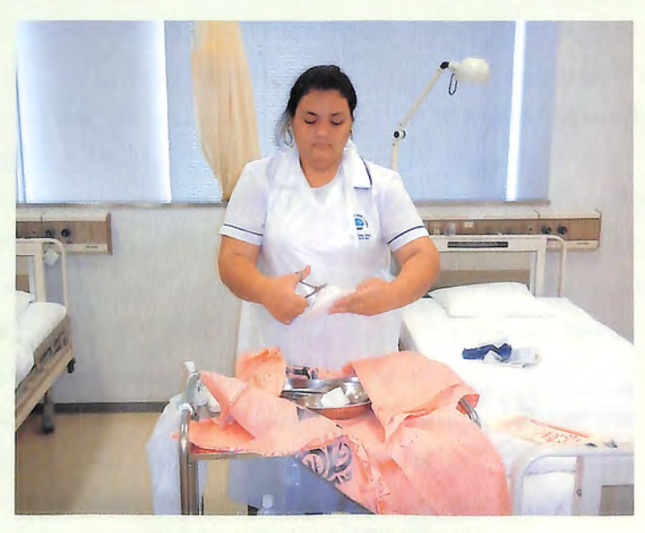
Aseptic technique in Samoan style 堂々と披露してくれたサモア現地での無菌操作