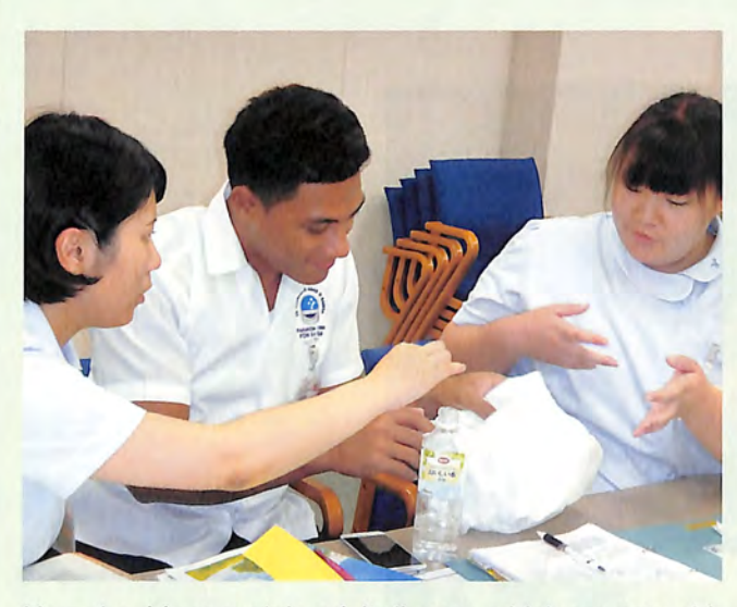
How should we explain adult diapers, which are not sold in Samoa? サモアにはない大人用おむつをどう説明しようか